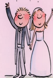
The Happy Couple

新婚夫妻 Caleb Tan 夫妇也邀请了各位在七月二十六日出席在盛港教会举行的午餐会。若你正在思考买礼物，这对新人很乐意接受红包。